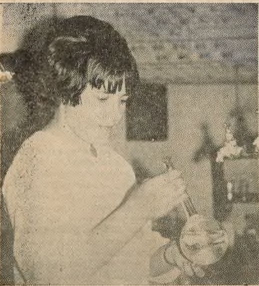
Хутка сесія. Шмат часу аддаюць студэнты хіміфака практычным заняткам у лабараторыях.

● Кліча юбілейны камуністычны суботнік ● Мацнеюць студэнцкія сувязі ● У цэнтры ўвагі — культура вёскі