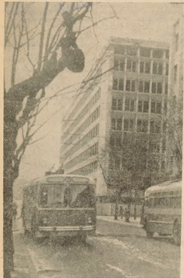
Узняўся ўзвысь новы корпус хімічнага факультэта.